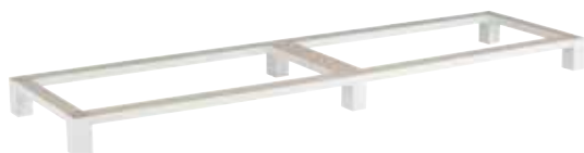
SENKIN JALKA 371 L. 140 CM, K. 9 CM, S. 39 CM