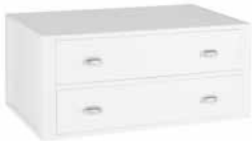
VAATEKAAPIN LAATIKOSTO 391 L. 100 CM, K. 46 CM, S. 60 CM ENIMMÄISPAINO LAATIKKOA KOHDEN 25 KG.