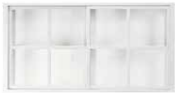
PIENI VITRIINI 140 610 L. 140 CM, K. 72,5 CM, S. 31 CM SAA MYÖS VALOILLA.