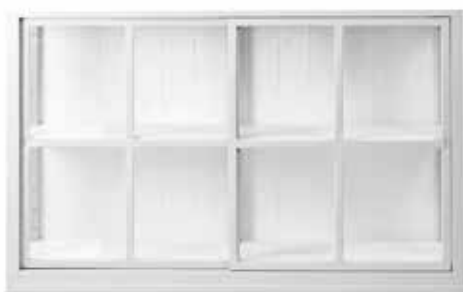
ISO VITRIINI 140 600 L. 140 CM, K. 81,5 CM, S. 39 CM SAATAVANA MYÖS VALOILLA.