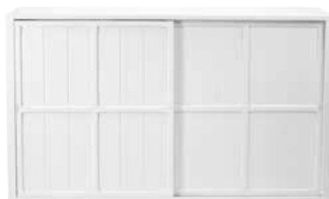
ISO VITRIINI PUUVILLA 140 621 L. 140 CM, K. 81,5 CM, S. 39 CM