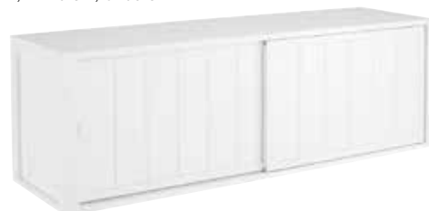
SENKKI KAHDELLA OVELLA 376 L. 140 CM, K. 46 CM, S. 39 CM