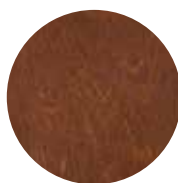
03 TUMMA RUSKEA