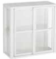
PIENI VITRIINI 310 L. 70 CM, K. 72,5 CM, S. 31 CM SAA MYÖS VALOILLA.