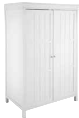
VAATEKAAPIN JALKA 392 L. 100 CM, K. 12 CM, S. 60 CM