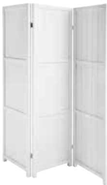
SERMI 383 L. 3X50 CM, K. 185 CM, S. 4 CM