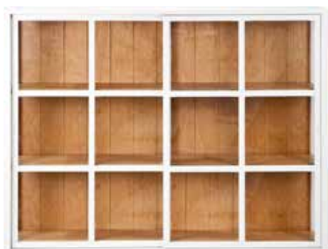
KORKEA VITRIINI 140 616 L. 140 CM, K. 105 CM, S. 31 CM SAATAVANA MYÖS VALOILLA.