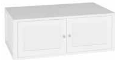
VAATEKAAPIN LISÄKAAPPI SÄLEOVILLA 397 L. 100 CM, K. 36 CM, S. 60 CM