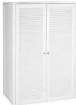
VAATEKAAPPI SÄLEOVILLA 390 L. 100 CM, K. 147 CM, S. 60 CM