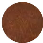
03 TUMMA RUSKEA