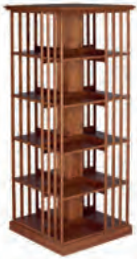
KARUSELLI-HYLLY. L. 60 cm, K. 156 cm, S. 60 cm.