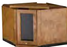
MATALA NURKKAVIDRIINI, 53 L. 42,5 CM, K. 31 CM