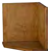
MATALA KULMAELEMENTTI, 72 L. 31 CM, K. 31 CM